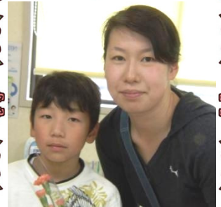
おかあさん ありがとう